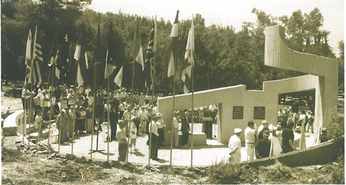
טקס חנוכת האנדרטה לזכרם של 119 אנשי המח"ל שנפלו במלחמת הקוממיות.