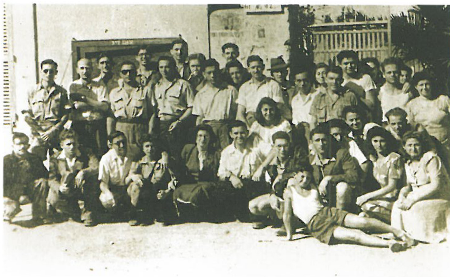
אנשי מח"ל מדרום אפריקה עם עובדים במחנה העקורים לדיספולי, איטליה, 1948.

המתנדבים, שרובם היו אזרחים אמריקנים וקנדים, סייעו לרכוש ולצייד את האניות שהיו ל"צי הצללים" של המוסד לעליית ב'. אילו נתפסו, עלולים היו לעמוד לדין על פי תקנות שעת חירום, על עזרה להגירה בלתי לגלית, והיו צפויים לעונש של עד שמונה שנות מאסר ו/או קנס של 10,000 לירות סטרלינג.