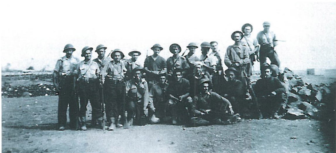
המחלקה הדרום-אמריקאית, גדוד 91.

ראשוני המגוייסים מקרב המתנדבים מנו כמה עשרות. הם הגיעו ארצה כבר בפברואר 1948, והשתתפו בקרבות (24 מן המתנדבים נפלו בקרבות עד ה-31 במאי 1948). מספרם של המתנדבים הלך וגדל לקראת יום הכרזת המדינה ועלה עוד יותר לאחר ההפוגה הראשונה, שנסתיימה ביולי 1948.