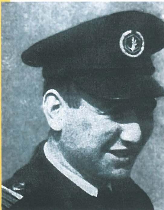
פול שולמן (ארה"ב), המפקד הראשון של חיל הים.

שולמן בן ה-26 את הפיקוד על חיל הים, בהביאו עימו נסיון של שירות בצי קרבי ומתקדם וידע בהפעלת כוחות ימיים. המינוי עורר ויכוחים רבים בפיקוד החיל, הן בשל גילו הצעיר והן על מידת התאמתו לתפקיד. שולמן פיקד על החיל בפעולות שליוו את מבצע "יואב", וביניהן טיבוע אונית הדגל המצרית "האמיר פארוק" בידי אנשי יחידת החבלה הימית בפיקודו של יוחאי בן-נון. הוא שירת בתפקיד זה עד מרץ 1949 ואז מונה ליועץ לראש הממשלה.