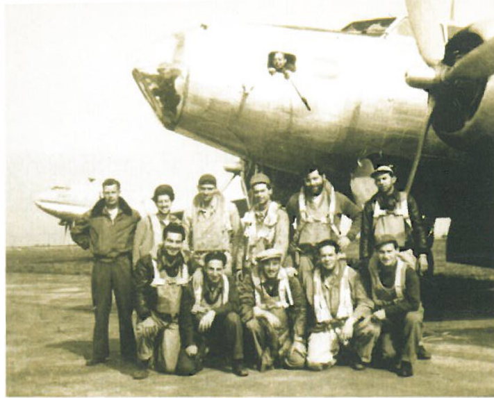
צוות מטוס B-17 בזאטץ, צ'כוסלובקיה, לפני המראה.