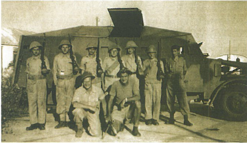
צוות שריונית ("סנדוויץ") מחטיבת אלכסנדרוני, גדוד 34. חלקם אנשי מח"ל מנורבגיה, דנמרק, דרום אפריקה, אנגליה וארה"ב.