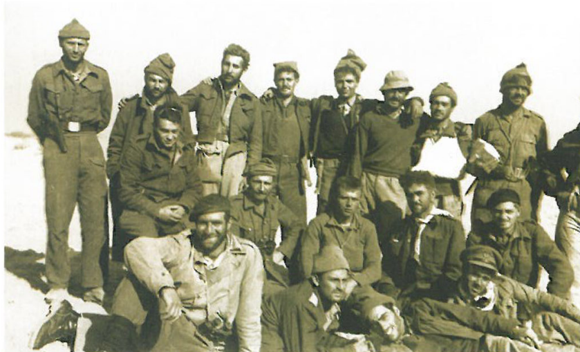
מחלקת מח"ל, גדוד 89, חטיבה 8 (מאנגליה, רודזיה, ארה"ב, הולנד, גרמניה ודרום אפריקה) לאחר כיבוש עוג'ה אל חפיר (ניצנה), דצמבר 1948.

חטיבת השריון 7 הפכה למעשה ל"חטיבת המח"ל". היא הורכבה מגדוד השריון 79 ושני גדודי חי"ר: 71 ו-72. בחודשי הקיץ היו בחטיבה כ-170 מתנדבים דוברי אנגלית ופלוגה אחת הורכבה בשלמותה ממתנדבים דוברי אנגלית. החטיבה השתתפה ב"מבצע דקל" לכיבוש הגליל התחתון ונצרת, בקרבות "עשרת הימים" ביולי 1948 ובמבצע "חירם" לכיבוש הגליל העליון והדיפת צבא ההצלה של קאוקג'י. בשלהי אוקטובר 1948 לקראת סוף המלחמה היו בחטיבה 7 כ-300 אנשי מח"ל מהם כ-240 בגדוד 72, כמעט כולם דוברי אנגלית.